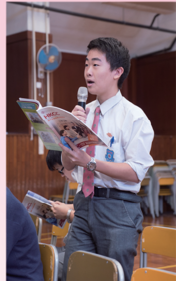
同學在香港專上學院講座上踴躍發問