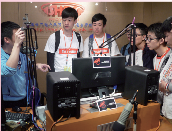
同學在世新大學一嘗當DJ的滋味