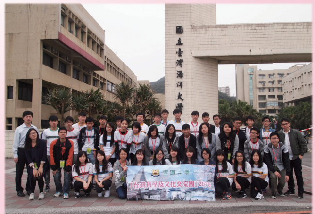
國立臺灣海洋大學校門前合照留念