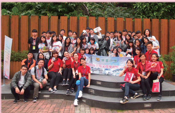
與世新大學的同學合照留念