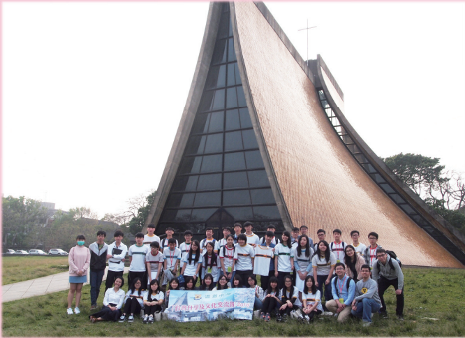
在東海大學路思義教堂前合照留念

台灣升學及文化交流團已於2016年3月29日至4月2日順利完成。參與學生共36名，探訪了當地兩所私立大學及一所國立大學，分別為東海大學、世新大學及台灣國立海洋大學。同學對此交流團反應正面。參觀完畢後，同學須交回專題研習報告、感想及製作展示板。