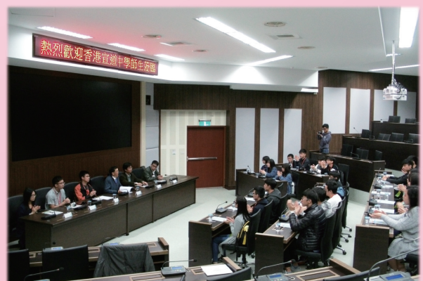
與國立臺灣海洋大學校長張清風會面