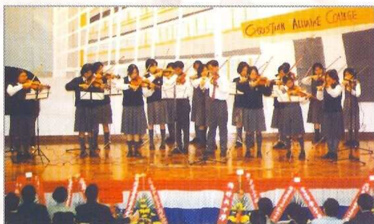
綜合晚會小提琴演奏

動組、性教育組、升學就業輔導組、訓導組等，透過多樣化的活動及各種措施如「全人發展獎勵計劃」，幫助同學們在各方面得以均衡發展，以應付他們於成長過程中所遇到的各種問題。