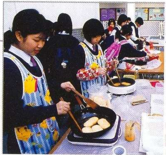
會計科活動-「識飲「飾食」

● 本校屬於基督教全日制男女子中學，全由政府資助。採用平衡班級結構即中一至中五各有五班，中六及中七各有二班。自一九九八年起由中一級開始採用中文為授課語言。於二〇〇二年至二〇〇三年中六及以上班級仍以英語為主要授課語言。