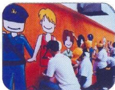
中門警署外牆壁畫創作

宣道中學已建立起嚴謹和淳樸的校風，同時也透過「學生自我實踐計劃」和「班本自訂目標實踐計劃」等幫助同學在品格上不斷求進。傑出風紀隊培訓計劃更為學校風紀提供全面的領袖培訓。宣中致力培養同學成為懂權利、講責任的良好公民。我們還透過各種宗教及德育活動，如福音週、團契、周會...等，讓同學建立正確的價值觀，邁向光明的人生。