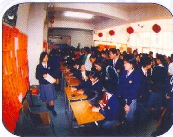
中文學會 喜氣洋洋寫揮春

本校屬於基督教全日制男女子中學，全由政府資助。採用平衡班級結構即中一至中五各有五班，中六至中七各有二班。