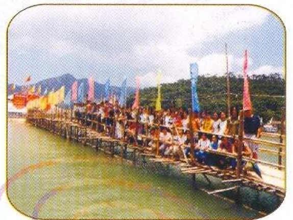
中六級大澳水鄉考察

初中除了一般的學科外，還有普通話、電腦科、設計與科技科及家政科。除了為同學提供寬基礎的課程外，亦透過安排相關的專題研習和全方位學習活動訓練同學獨立思考、求知求真、分析解難的學習能力。至於高中及預科課程方面，除有文組、理組的分科外，也開設了會計學和電腦等科目。